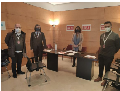
Fotografia de la reunió amb PSPV